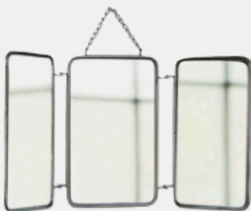
Miroir de barbier vintage. Prix 39 € brocantelab.com