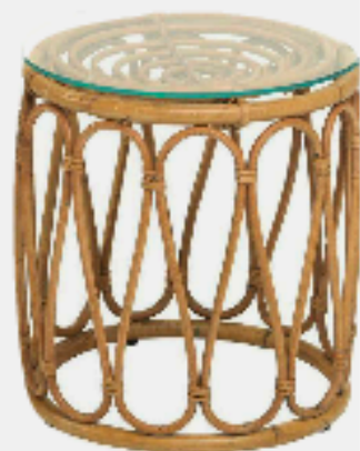
Bout de canapé Pouf en rotin, coiffé d'un plateau de verre de 36 cm de diamètre pouvant servir de table basse ou de chevet. Prix 85 € - kokmaison.com