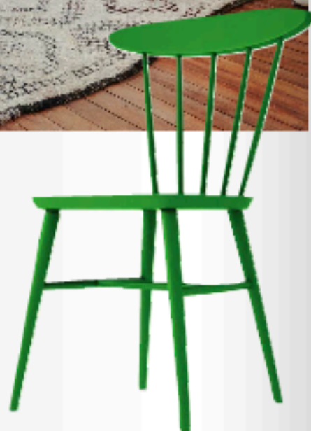
Chaise Bois de bouleau peinte en vert. Prix : 99,95 € lestendances.fr